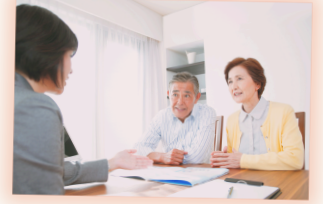
※ 相談風景のイメージです ※ オンライン対応もできます